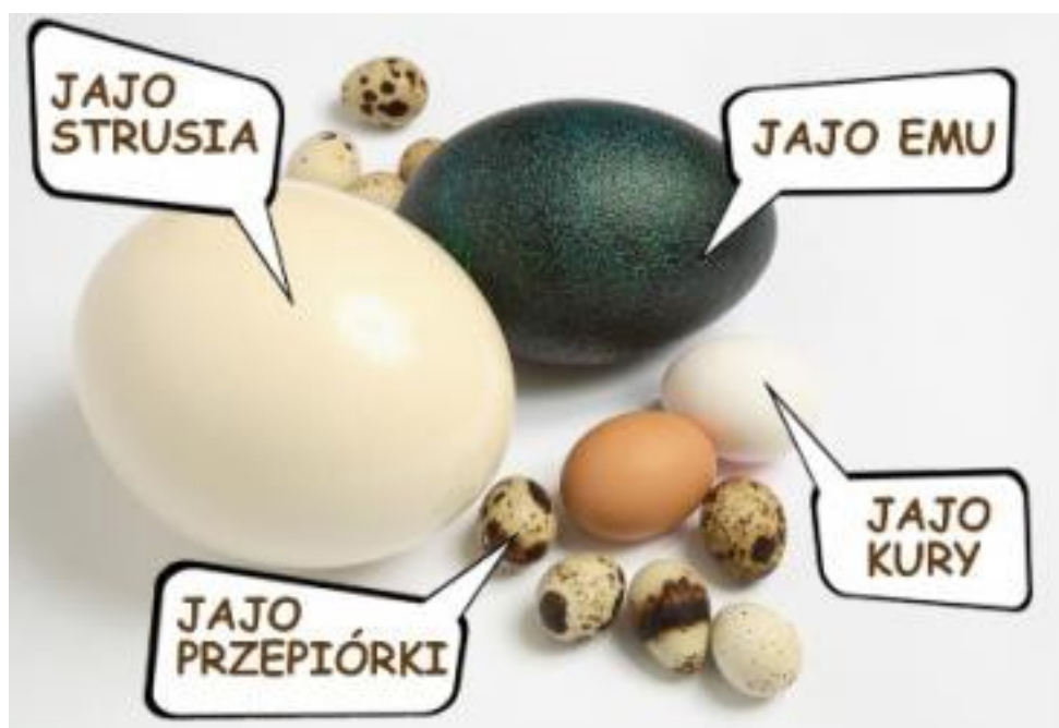
Zdjęcie nr 2 Porównanie wielkości jajek różnych ptaków